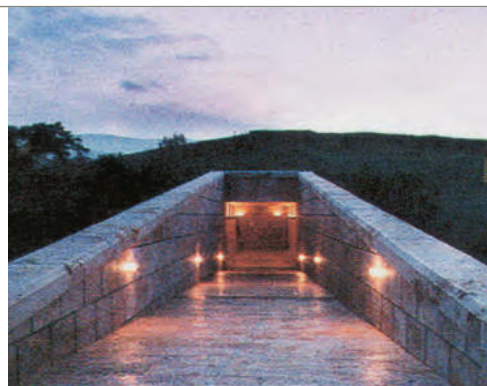
6. Η είσοδος στον χώρο των βασιλικών τάφων που ανακαλύφθηκαν στη Βεργίνα

Πάπυρος Λαρούς Μπριτάνικα, τόμος 14ος, σ. 91-92