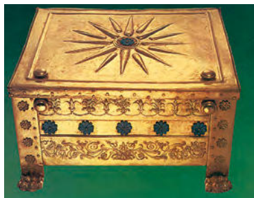
5. Χρυσή λάρνακα με το έμβλημα των Μακεδόνων βασιλιάδων (Βεργίνα, κτίριο προστασίας βασιλικών τάφων)

Ο Αλέξανδρος σ' έναν λόγο του λέει στους Μακεδόνες: